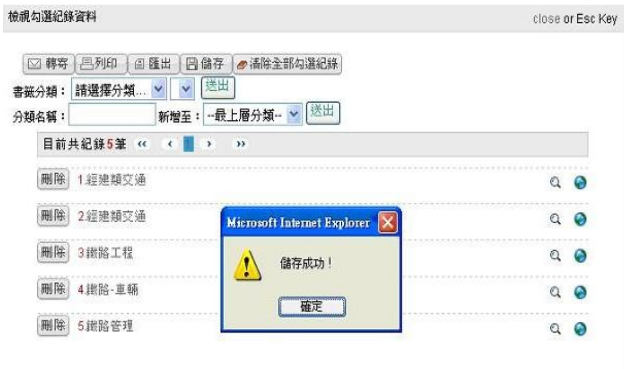
圖 5 儲存查詢結果至「我的資料夾」

查詢結果出現後，可將之進行儲存。首先勾選欲儲存的目錄，點按「檢視全部勾選紀錄」，系統會跳出另一視窗，依序點按「儲存」與「送出」確認儲存結果，出現「儲存成功」之視窗（如圖 5），即成功將查詢結果儲存至個人化服務之「我的資料夾」。