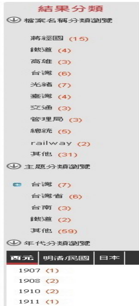
圖 6 查詢結果分類