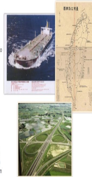
圖 7 平台英文簡介

ACROSS applies metasearch technology for real-time retrieval of the cooperation institutions' holdings, and minimizes the inconvenience of searching across different databases so that users can rapidly access the information they need. As the ACROSS integrated archives are maintained by the cooperation agencies and the search results shown through this platform are the common archives resources catalogue. If users need more detailed information, they can use the "link to the source database" button to return to the original agencies. The copyright of the content that ACROSS search results shown belonged to the cooperation agencies.