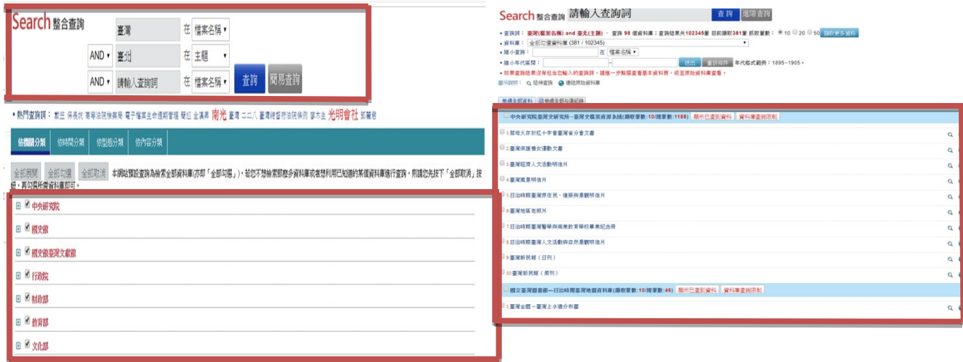
圖 3 進階查詢與查詢結果

若要針對一個或多個查詢欄位進行特定需求查詢，可利用「進階查詢」方式查詢。於進階查詢畫面輸入查詢詞，並指定查詢的特定欄位（如「檔案名稱」與「內容描述」），以及欄位之間的關係（交集 AND、聯集 OR、排除 NOT）後，再勾選欲查詢的資料庫，點按「查詢」，即可產出查詢結果（如圖 3）。